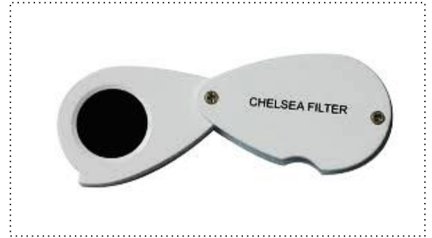
รูปที่ 1 แว่นกรองแสงเชลซี ( Chelsea Filter )

แว่นกรองแสงเชลซี ( Chelsea Filter ) เป็นแผ่นกรองแสงที่ยอมให้แสงสีเขียวยและแสงสีแดงผ่านได้เท่านั้น จึงนิยมนำมาใช้แยกมรกตธรรมชาติกับมรกตสังเคราะห์หรืออัญมณีสีเขียวที่นำมาเลียนแบบมรกต