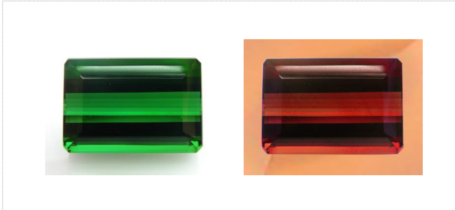
รูปที่ 3 โครมทัวมาลีนหลังจากใช้แว่นกรองแสงเชลซี ( Chelsea Filter )

ตารางแสดงผลการใช้แว่นกรองแสงเชลซี ( Chelsea Filter )