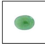
หยกเจไดต์ (Jadeite)

หยกเป็นอัญมณีที่มีค่า ราคาสูง และได้รับความนิยมค่อนข้างมาก โดยหยกที่ได้รับการยอมรับในตลาดแบ่งออกเป็น 2 ชนิดคือ 1. หยกเจไดต์ (Jadeite) มีค่าความแข็งตามสเกลของโมห์เท่ากับ 6.5 – 7 ทางการค้านิยมเรียกว่า “หยกพม่า” และ 2.หยกเนฟไฟต์ (Nephrite) มีค่าความแข็งตามสเกลของโมห์เท่ากับ 6 – 6.5 ทางการค้านิยมเรียกว่า “หยกจีน” ซึ่ง หยกเจไดต์ จะมีราคาสูงกว่าหยกเนฟไฟต์ เนื่องจากมีคุณภาพดีและสวยงามมากกว่า