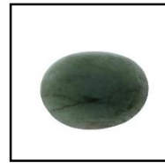
หยกเนฟไฟต์ (Nephrite)

หยกเจไดต์ (Jadeite) ที่มีคุณภาพดี มีราคาค่อนข้างสูง จึงได้มีการนำหยกเจไดต์คุณภาพที่ต่ำมาทำการปรับปรุงคุณภาพ เพื่อให้มีความสวยงามยิ่งขึ้น โดยการปรับปรุงคุณภาพของหยกแบ่งเป็น 4 ชนิด (type) ได้แก่